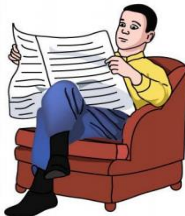
read the paper