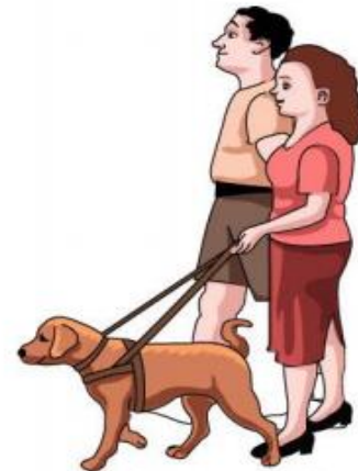
go for a walk