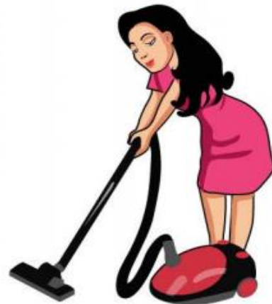
clean the house